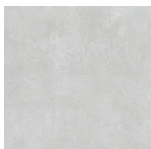
NORWIK SMOKE NATURAL