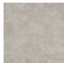
NORWIK GREIGE PULIDO