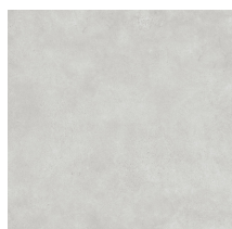
NORWIK SMOKE PULIDO