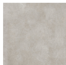
NORWIK GREIGE NATURAL