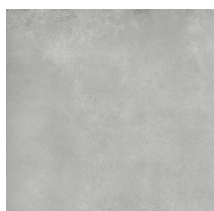
NORWIK GREY NATURAL