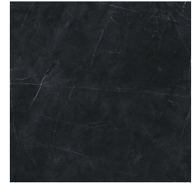
TESSINO BLACK PULIDO RECTIFICADO