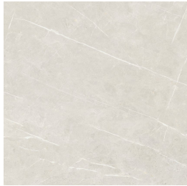
TESSINO IVORY PULIDO