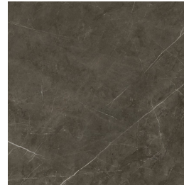
TESSINO BRONZE PULIDO