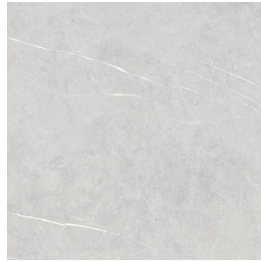
TESSINO SMOKE PULIDO