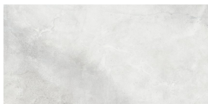
IRHAM GRIS PULIDO RECTIFICADO