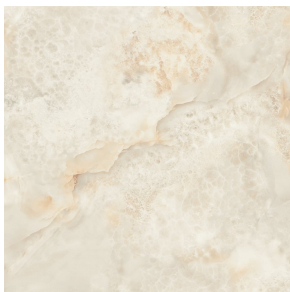
ARAL CREAM PULIDO